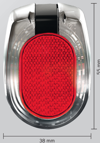
Abbildung in Originalgröße

Das neue SECULA ist das ideale Rücklicht für die Schutzblechmontage. Technisch: Das LineTec-Prismensystem mit seiner eleganten Klarglas-Optik ist als Kranz um den Rückstrahler gelegt. Es leuchten rote Lichtkreise strahlend hell. Die aktive Signalisationsfläche ist extrem groß, obwohl das Rücklicht in der Form selbst äußerst zierlich ist.