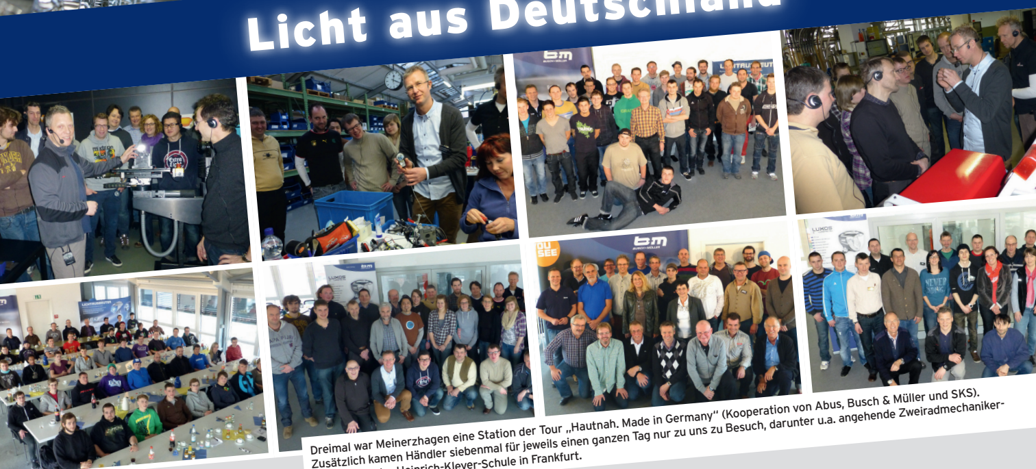
Dreimal war Meinerzhagen eine Station der Tour „Hautnah. Made in Germany“ (Kooperation von Abus, Busch & Müller und SKS). Zusätzlich kamen Händler siebenmal für jeweils einen ganzen Tag nur zu uns zu Besuch, darunter u.a. angehende Zweiradmechaniker-Meister von der Heinrich-Kleyer-Schule in Frankfurt.

Wir laden Sie gerne zu den nächsten Terminen ein (ab Herbst 2013). Einfach eine E-Mail an info@bumm.de schicken. Stichwort: „Lichttage Meinerzhagen“. Wir informieren Sie dann rechtzeitig und bevorzugt über die Termine.